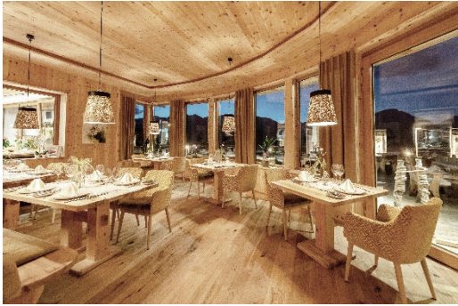
© Rene Strasser Regionales Naturkulinarium für Genussmenschen