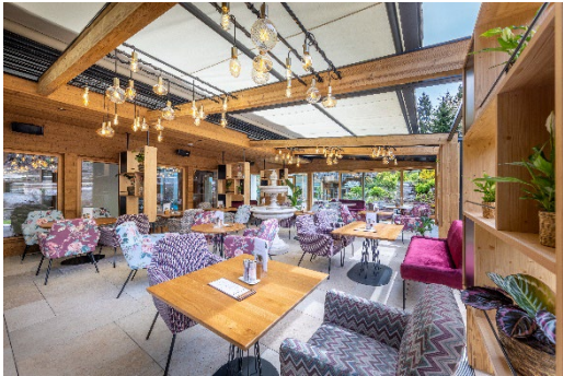
© Harald Steiner Neue Orangerie mit lichtdurchfluteten Glasfronten